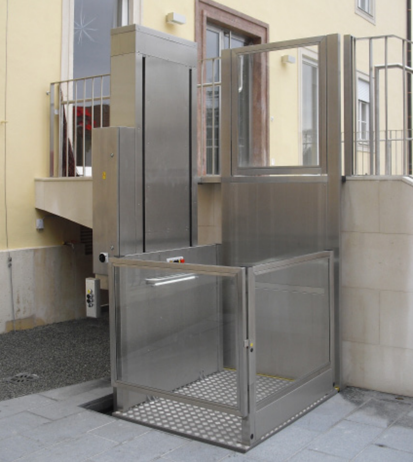
Lift mit 70mm Schachtgrube und Ausführung in Edelstahl

Glasschacht mit Stahl oder Aluminiumrahmen als Option