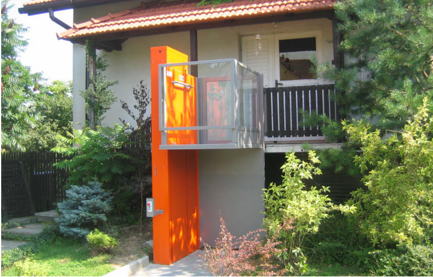
Spezielle RAL Farbe für Teile der Anlage