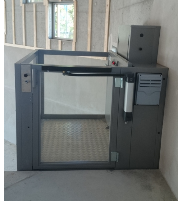
Obere Tür kann manuell oder automatisch öffnen